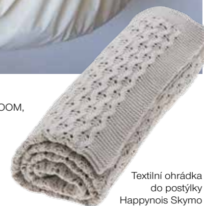
Pletená deka VINTER & BLOOM, 890 Kč, babyliving.cz