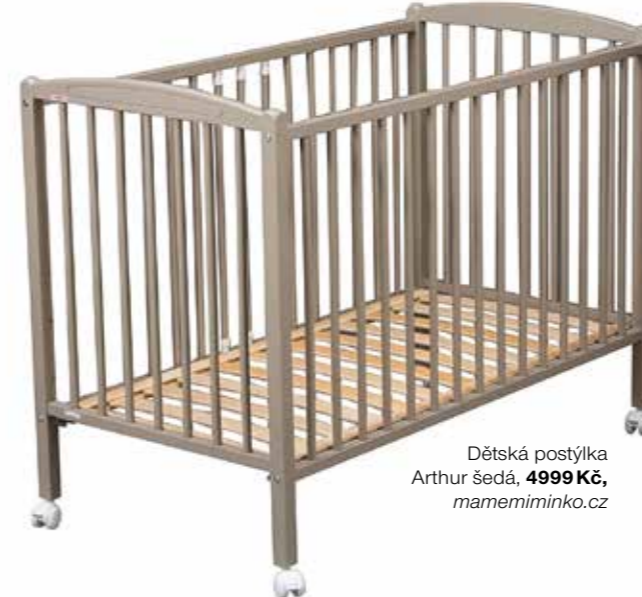
Dětská postýlka Arthur šedá, 4999 Kč, mamemiminko.cz