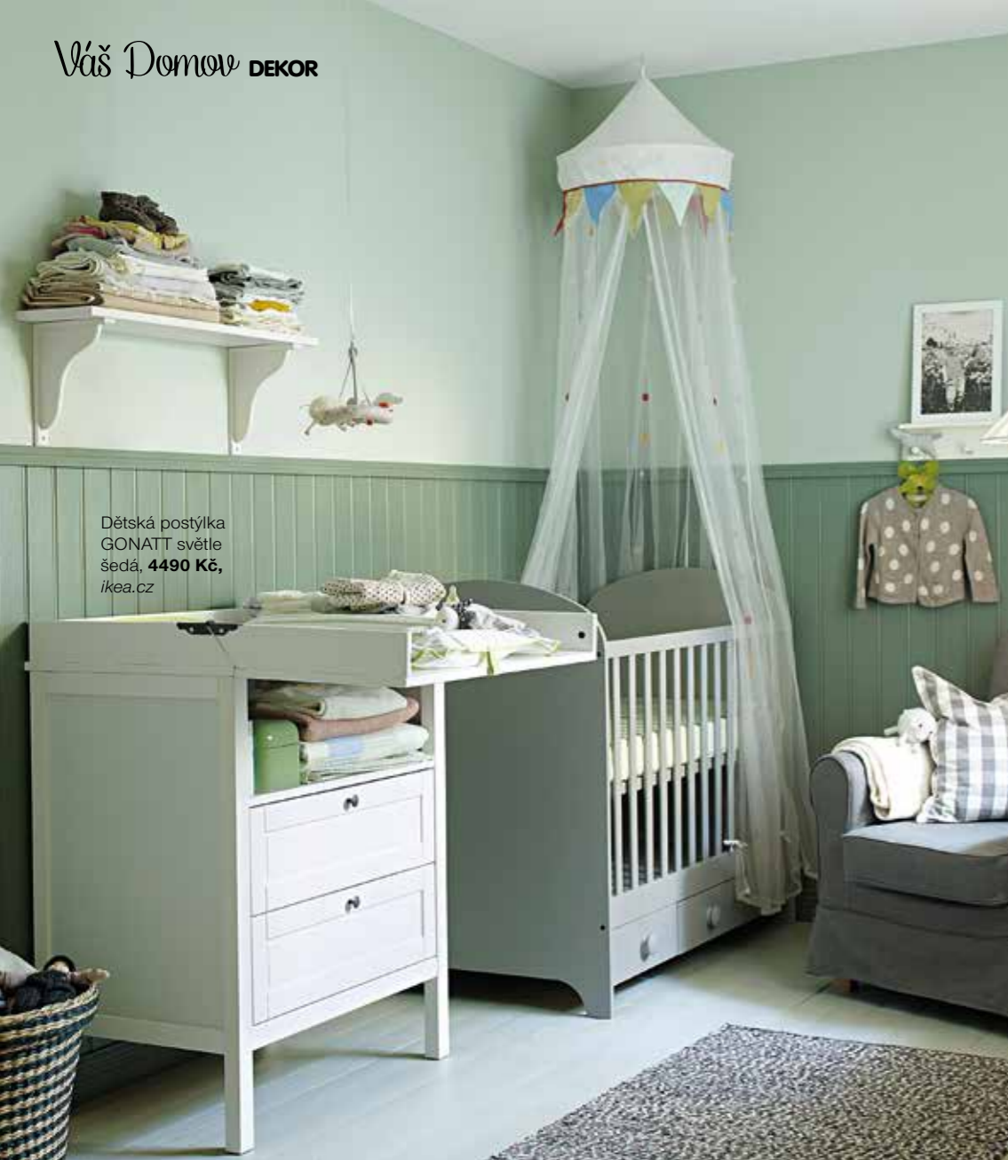
Dětská postýlka GONATT světle šedá, 4490 Kč, ikea.cz