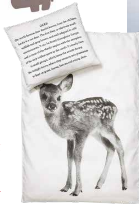
Dětské povlečení Deer, 1329 Kč, nordicday.cz

Na konstrukci postýlky záleží, ale na čem záleží ještě víc, je matrace. Vhodně zvolenou matrací podpoříte správný vývoj páteře dítěte. Musí být pevná, ideálně střední tvrdosti. Zcela nevhodná je měkká matrace. Její výška by měla být kolem 10 cm, kvůli možnosti použití monitoru dechu. Z materiálů jsou vhodné kvalitní pěnové matrace nebo přírodní kokosové vlákno. Důležitou součástí by měl být prodyšný a snímatelný potah, který lze prát i při teplotě 90°C. A pro jistotu lze dokoupit ještě voděodolný ochranný potah. Povlečení, prostěradlo, deky, mantinely nebo polštářky volte bavlněné, jsou příjemné na dotek.