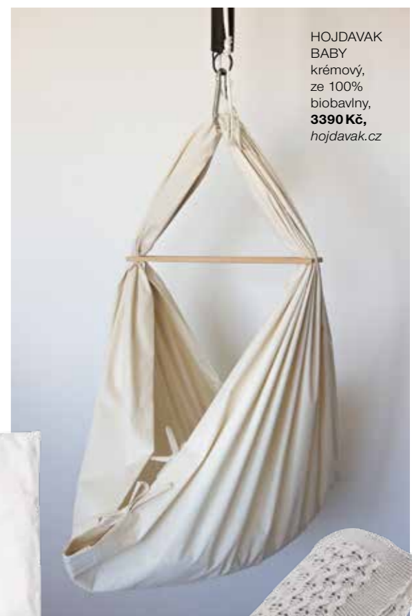
HOJDAVAK BABY krémový, ze 100% biobavlny, 3390 Kč, hojdavak.cz